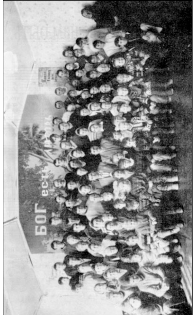
Община СЦ ЕХБ города Бельцы. (Фото 1996 года)