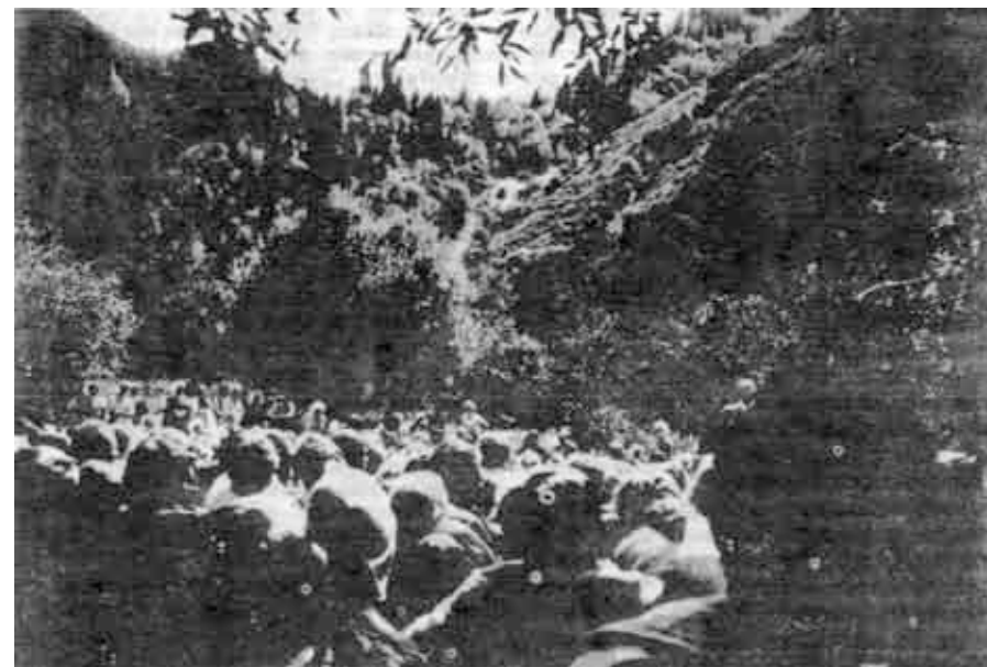
Живая природа стала храмом хвалы Богу