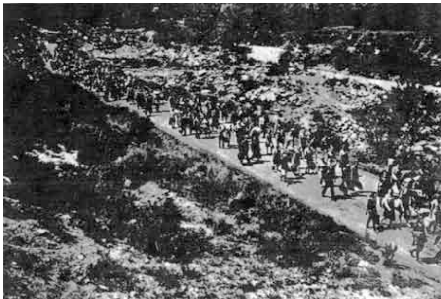
На пути в горы

Я сердечно благодарен Богу, что и в эти благословенные дни Он так явно дал ощутить Своим детям Его бесконечную любовь, благодать, силу, помощь. Хвала Ему вовек!