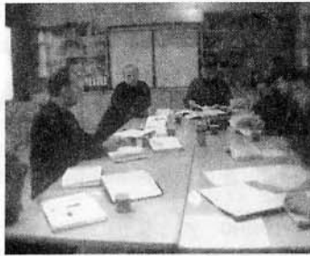
Во время работы миссионерского комитета. Г.Москва