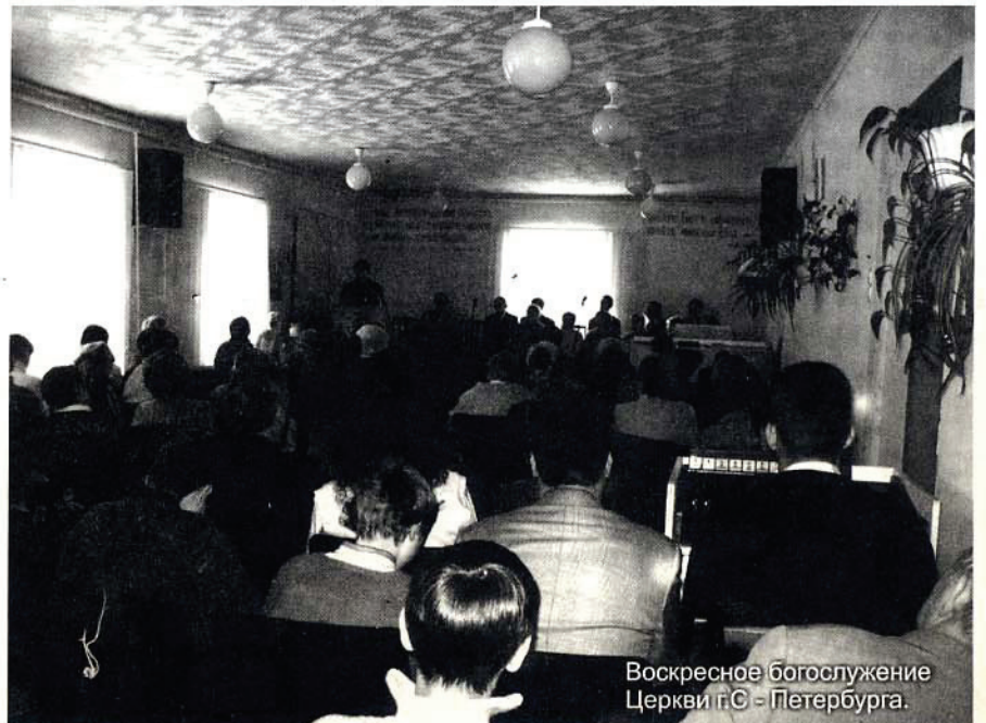
Воскресное богослужение Церкви г.С - Петербурга.